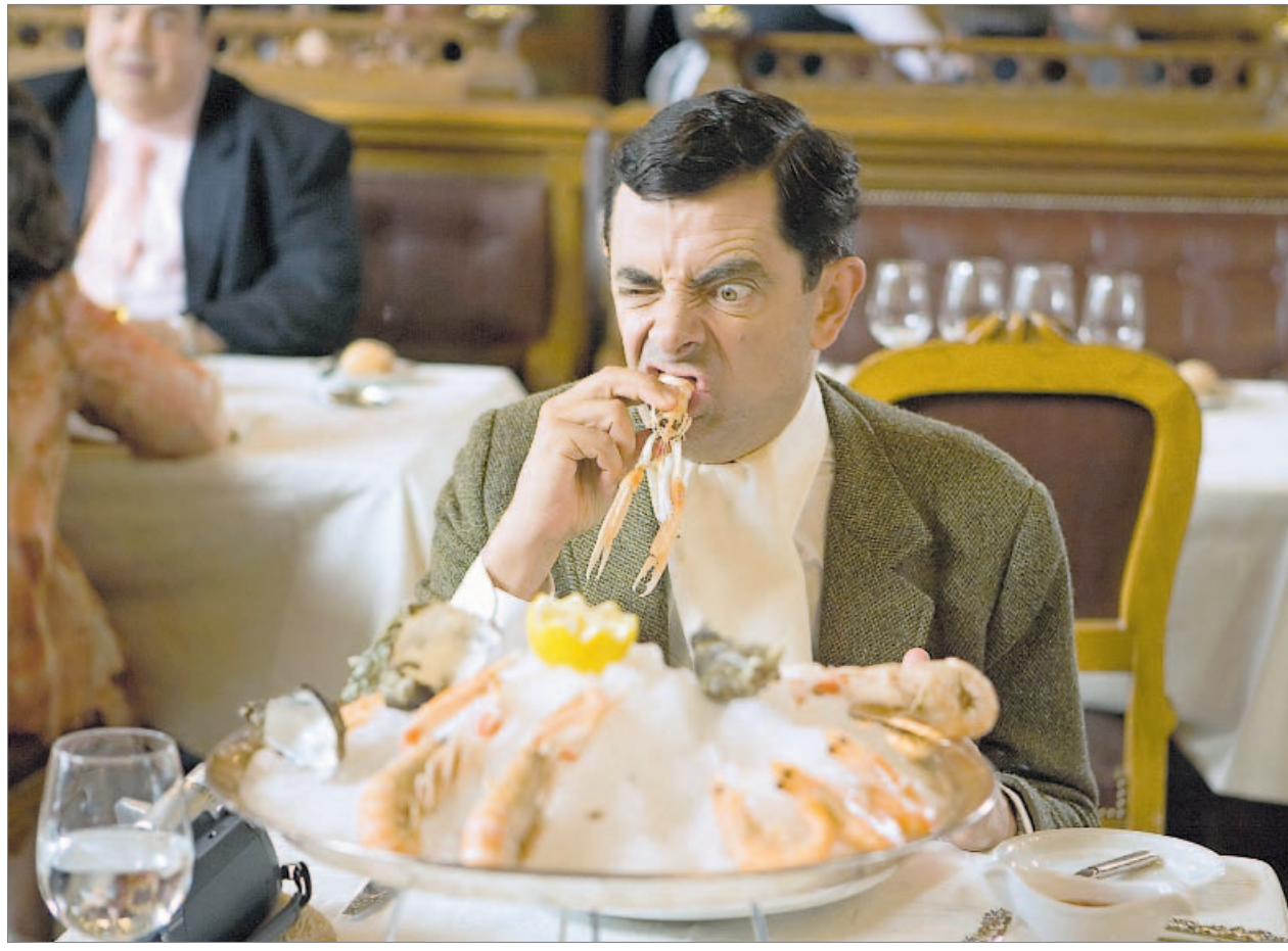
Mr. Bean kämpft hier mit einem Schalentier. Aber auch das Essen von Kartoffeln birgt Komplikationen.